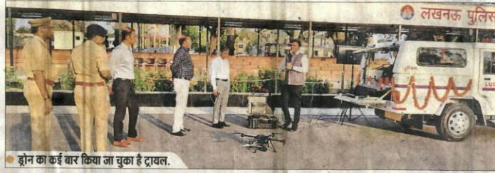
ड्रोन का कई बार किया जा चुका है ट्रायल.