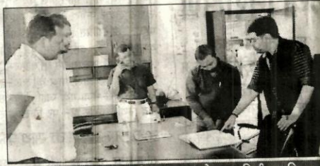
डीएम ने शिकायत निस्तारण कंट्रोल का निरीक्षण किया

इसके अलावा जिला निर्वाचन अधिकारी जिला अधिकारी ने कहा कि भारत निर्वाचन आयोग के निर्देशानुसार आधार कार्ड, मनरेगा जॉब कार्ड, बैंको/डाकघरों द्वारा जारी किये गये फोटोयुक्त पासबुक, श्रम मंत्रालय की योजना के अन्तर्गत जारी स्वास्थ्य बीमा स्मार्ट