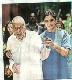
Citizens can access form 12D on the Election Commission of India website to request postal ballots at home

Sarojini Nagar constituency leads with 582 booths, followed by BKT 487, Lucknow East 417, Lucknow West 414, Malihabad 405, Mohanlalganj 399, Luc-